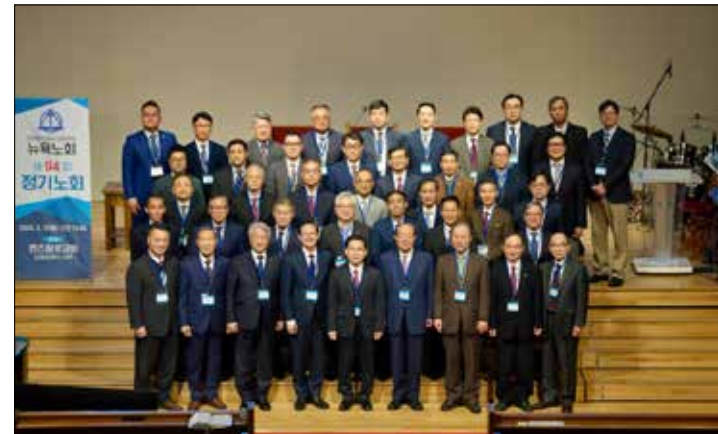
뉴욕노회 제94회 정기노회 중 참석자들이 기념 촬영을 했다