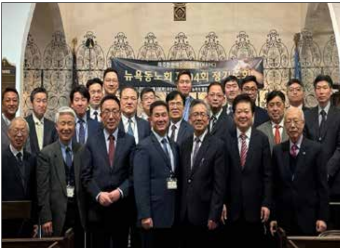
KAPC 뉴욕동노회 제94회 정기노회 사진 촬영했다