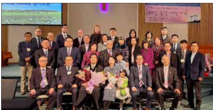
KAPC 기든노회 정기노회 사진 촬영했다