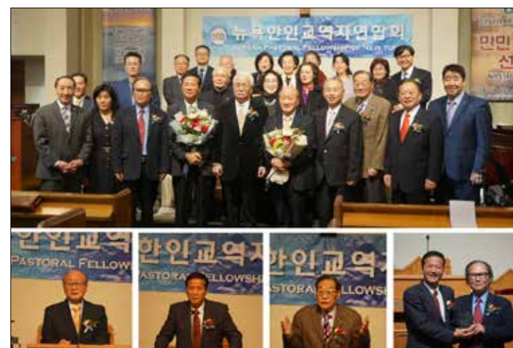
뉴욕한인교역자연합회, 제3회 총회 사진