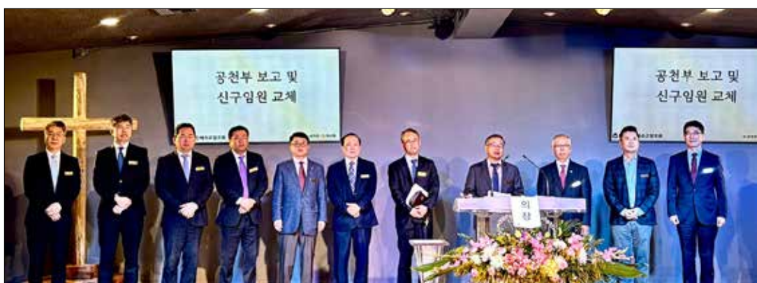
KAPC 남가주노회에서 신규임원들이 기념촬영하고 있다