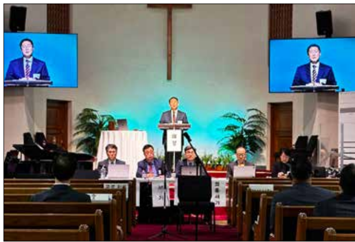
KPCA 102회 서노회가 갈보리침묵교회에서 열렸다