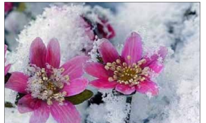
꽃샘추위속에서 피어나는 봄 꽃

"여호와와는 죽이기도 하시고 살리기도 하시고 스올에 내리기도 하시고 거기에서 올리기도 하시는도다. 여호와와는 가난하게도 하시고 부하게도 하시고 낮추기도 하시고 높이기도 하시는도다. 가난한 자를 진토에서 일으키시며 빈궁한 자를 거름더미에서 올리사 귀족들과 함