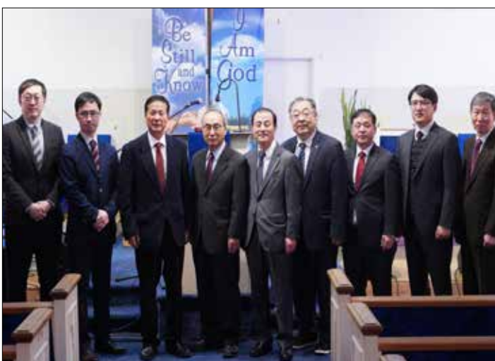
KAPC 뉴욕남노회 제26회 정기노회 사진 촬영했다