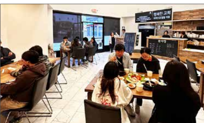
행복한교회는 태국선교를 후원하는 일일식당을 한미정에서 열었다.jpg