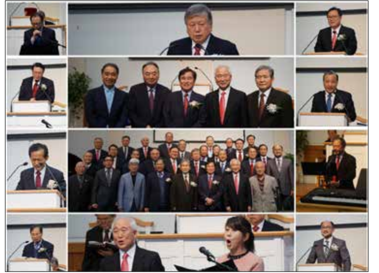
뉴욕 선교사의 집 감사예배 후 기념촬영을 했다