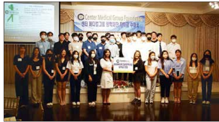
센터메디컬그룹이 2023년 '센터 IPA 파운데이션 장학생'을 선발한다