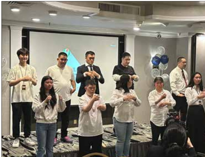
뉴욕밀알선교단 장애 교우들의 바다위십 찬양