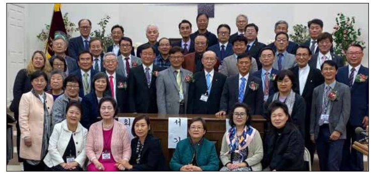
제44회 대한예수교장로회 미주합동 총회 참석자들이 함께 기념 촬영 했다