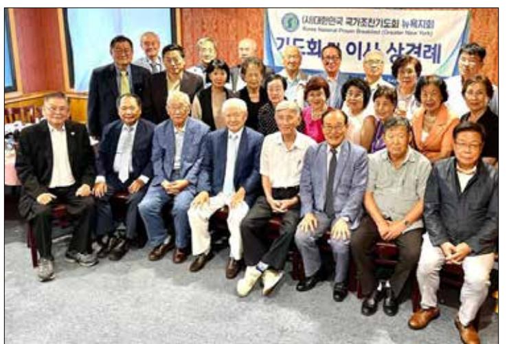
대한민국국가조찬기도회 및 이사 상견례 후 사진 촬영