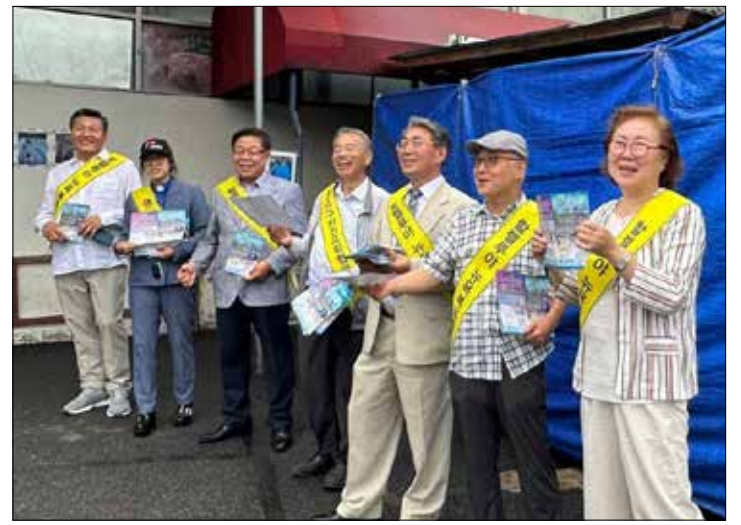
뉴욕교협, 뉴욕선교 및 할렐루야 대회를 앞두고 홍보하고 있다