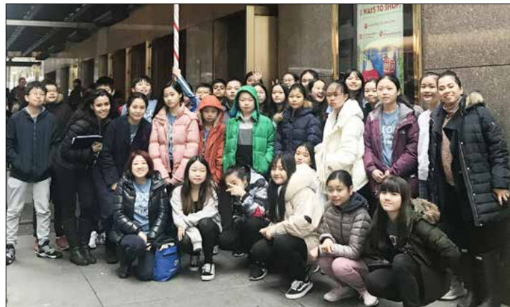
뉴욕가정상담소 호돌이 방과후 학교 프로그램