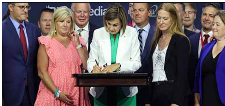
아이오와 주 주지사, 김 레이놀즈가 "heartbeat bill" 에 서명하는 모습

지난주, 7월 14일 금요일, 디모인(Des Moines)에서 열린 Family Leadership Summit에서 아이오와주 공화당 주지사인 김 레이놀즈 주지사가 아이오와주에서는 '태아 심장박동 Fetal Heartbeat Law' 법안을 통과시키는 발표했습니다. "태아심장박동 법안"이란 6주가 지난 심장이 뛰는 태아를 죽이는 것을 막는 낙태금지법안(Heartbeat bill)입니다. 이로써 아이오와주는 태아를 보호하는 심장박동 법안을 통과시킨 13번째 주가 되었습니다.