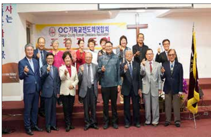
7월 월례조찬기도회 참가자들

을 안고 돌아왔습니다. 그는 고향으로 돌아와 몇몇 친구들과 함께 전쟁터에서 부상당한 자를 돕기 위한 운동을 적극적으로 펼쳤습니다. 그래서 탄생한 것이 저 유명한 적십자사업입니다. 듀넌트는 첫 번째 노벨상 수상자가 되었습니다. 때론 역경에 부딪혀 우리의 꿈이 깨어질 때가 있습니다. 그러나 그 꿈이 깨어졌다고 좌절하지 말고 나의 깨어진 꿈을 예수 그리스도의 손에 맡겨 보십시오. 그리하면 과거 어떤 꿈보다 비교할 수 없는 더욱 위대한 꿈을 이루게 하실 것입니다. 나를 위한 삶, 이웃을 위한 삶, 조국을 위한 삶으로 더욱 아름답게 승화시켜 주실 것입니다. songkpak@hotmail.com