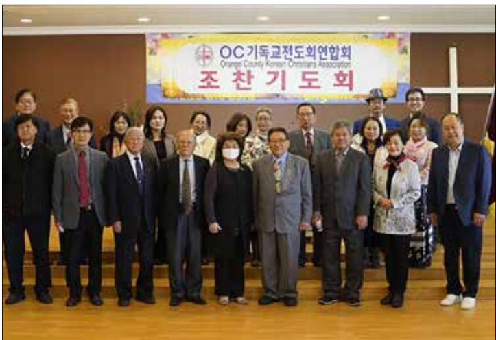
OC기독교전도회연합회 총회에서 참석자들이 기념촬영하고 있다.