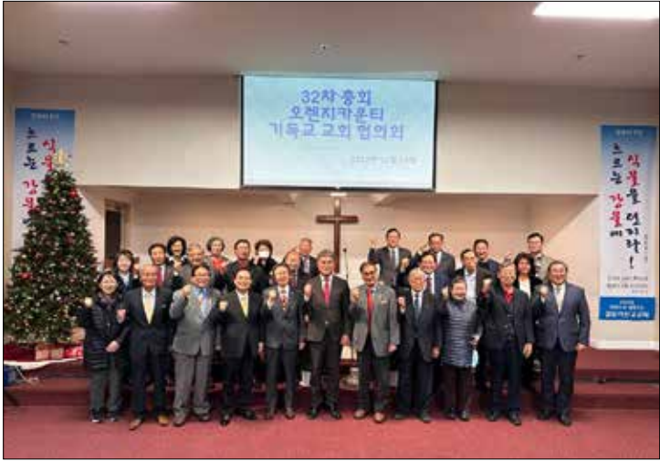
OC협총회를 마치고 참석자들이 단체사진을 찍고 있다