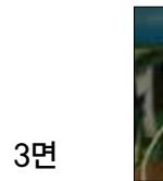
3면 푸른초장 여운세 목사