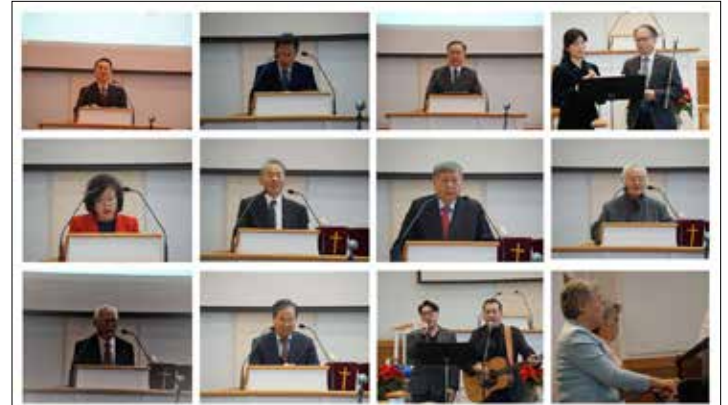
사모 위로의 시간 및 성탄 감사예배 순서자들