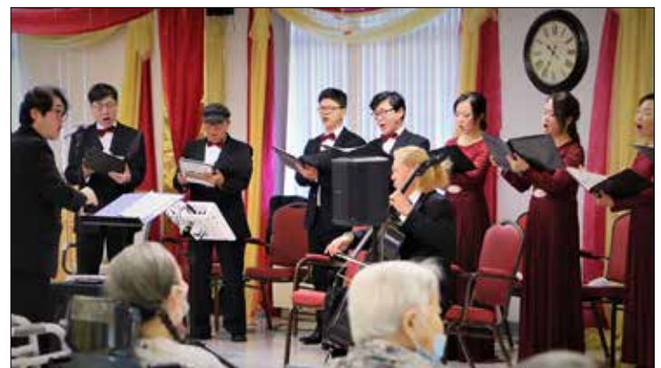
뉴욕미션콰이어가 유니온널싱홈에서 성탄 찬양을 부르고 있다