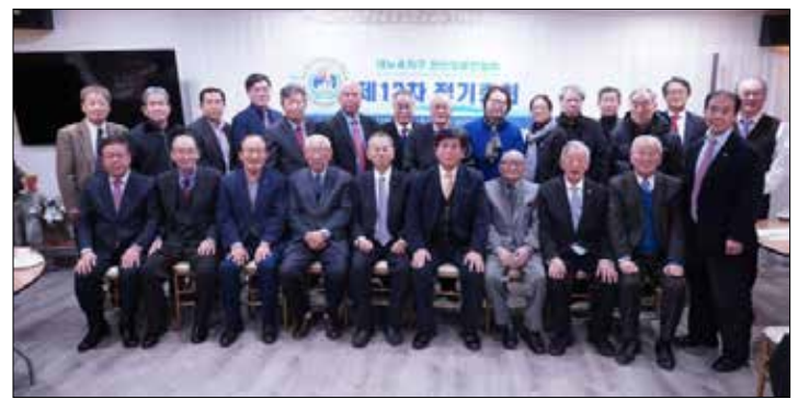
뉴욕장로연합회 회원들이 제13회 정기총회 후 함께 단체촬영을 했다