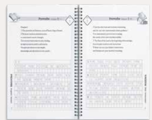
영어성경말씀을 읽고 묵상하며 네모 칸마다 소린 글씨위에 똑똑똑막 한글로 예쁘게 써주세요.