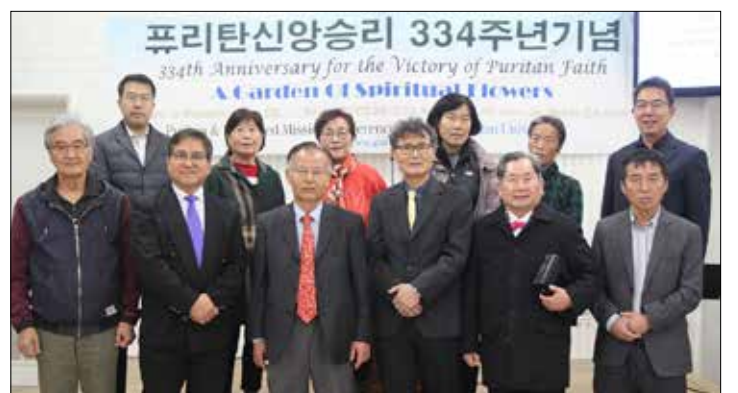
퓨리탄신앙승리 334주년 기념행사를 마치고 회원들이 기념촬영을 하고 있다

성화장로교회(담임 이동진 목사)는 새해감사 온마음예배를 1월 2일(월)부터 4일(수)까지 오후 7시에 개최한다. 강사는 정공필 목사(라스베가스장로교회)이며 4일(수)은 제직수련회를 겸해서 연다. ▲ 문의: (213)447-3118