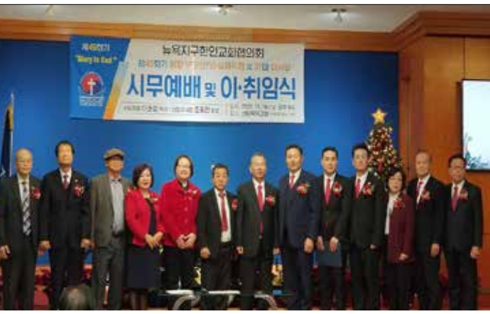
뉴욕교협 제49회기 임원이 기념촬영을 하고 있다