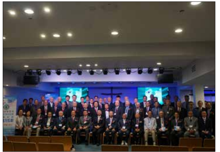
(사) 대한민국 국가조찬기도회 뉴욕지회 연례기도회를 마친 후 사진촬영 했다