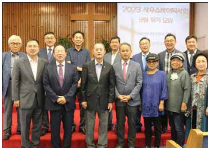
사우스베이한인목사회 9월 정기예배 참석자들이 기념촬영하고 있다