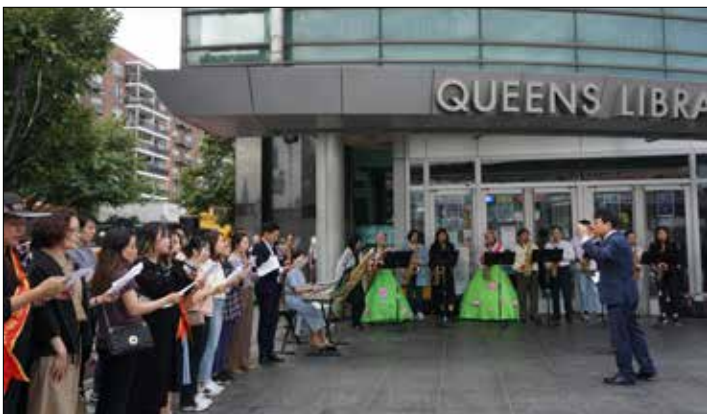
노방전도회에 참석한 모두가 연주와 찬양하고 있다