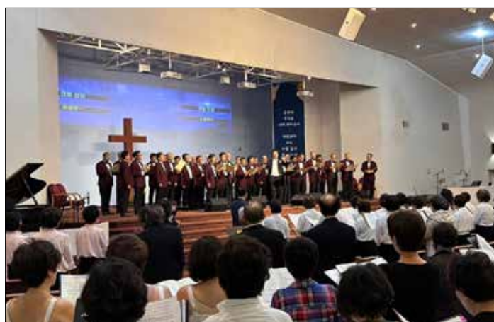
남가주장로협 주최 사랑의 찬양제에서 참가자들이 연합으로 찬양하고 있다