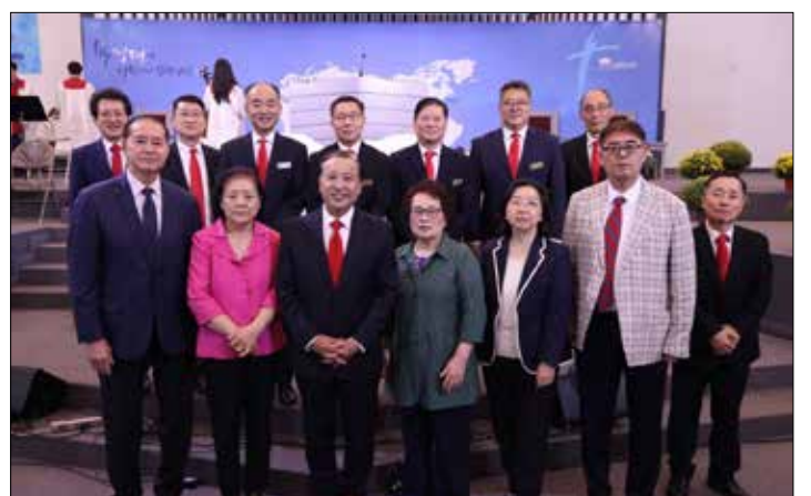
설립 53주년 연합감사예배 후 사진촬영 했다