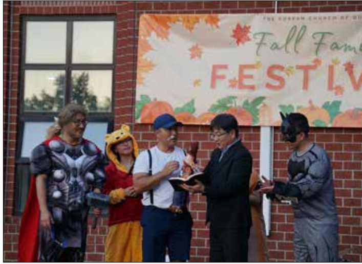
제 4회 온 가족 가을 축제 슈퍼 히어로 스킷