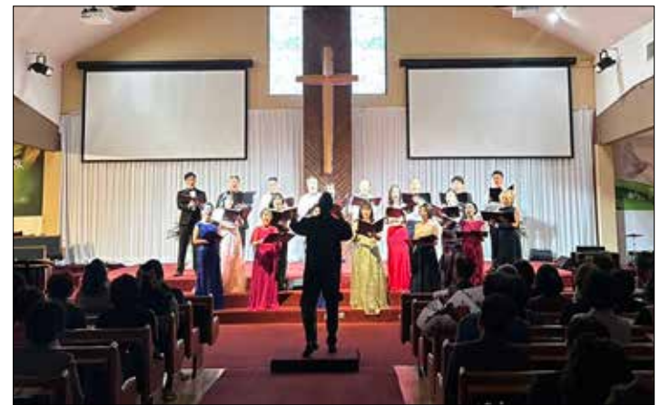
2023년 한국가곡의 향연이 미주평안교회에서 열렸다