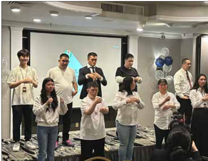
뉴욕밀알선교단 장애 교우들의 바다위십 찬양