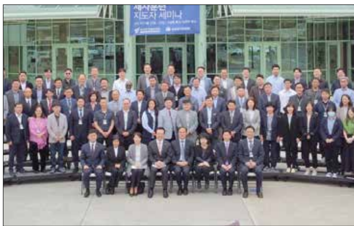
제자훈련세미나 참석자들이 단체사진을 찍고있다

1988년 나성영락교회 2대 담임으로 부임한 박 목사는 지난 16년간 교회를 크게 부흥시키기도 했다. 박 목사는 사회적으로도 한류기독교연맹 공동회장, 우리민족서로돕기 미주대표, 4·29 장학재단 이사장, 풀러신학교 이사 등 해야 할 수 없이 많은 사회 단체와 기독교 단체들의 대표를 맡아 공헌해 왔다. 은퇴 후에는 새생명선교회를 설립해 중국, 과테말라, 동티모르, 몽골 등의 국가에서 교회 설립을 지원했고 필리핀, 루마니아 등 5개 국가에서 교회 지도자 세미나를 개최했다. 금년 봄 재미한인기독교재단(KCMUSA)에서 출간한 ‘미주한인교회사’는 박희민 목사가 발행인으로서 마치