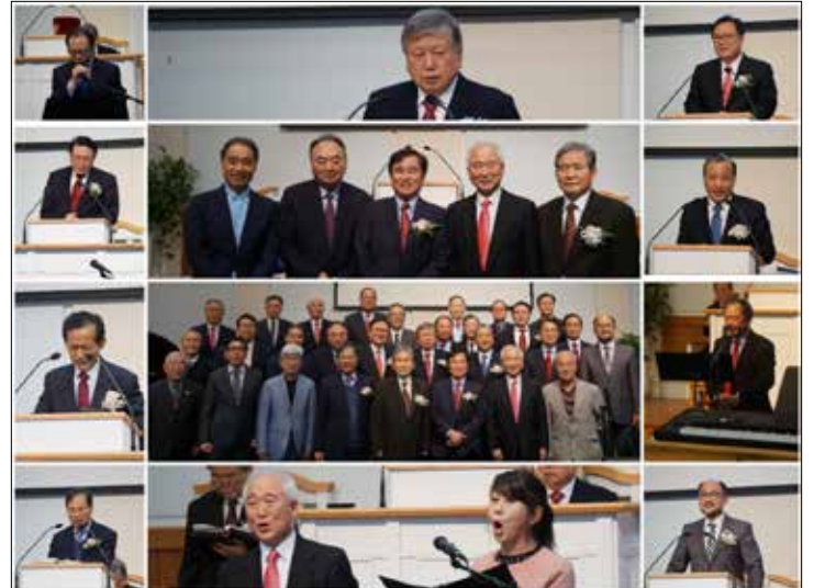
뉴욕 선교사의 집 감사예배 후 기념촬영을 했다