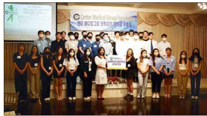
센터메디컬그룹이 2023년 '센터 IPA 파운데이션 장학생'을 선발한다