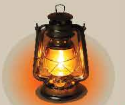
마지막 정성속에 함께 보낸 31년 Since 1988, 최초의 한인 공인장례사