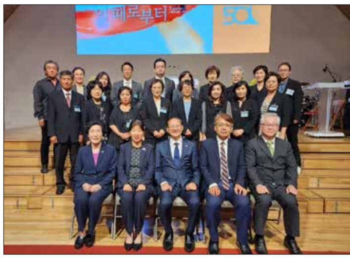
개강예배 후 참석자들이 함께 기념 촬영을 했다

첼위지 목사는 "선물을 전달할 때 받는 사람에게 맞게 전달해야 한다"며 "인간은 모두 죄인인데 죄인에게 죄를 사해 주는 것이 가장 큰 선물이다. 우리에게 가장 큰 선물이 예