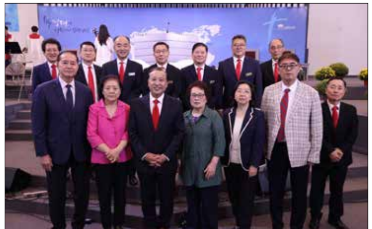
설립 53주년 연합감사예배 후 사진촬영 했다