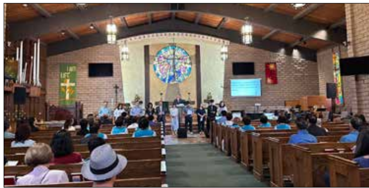
좋은마을교회 창립 39주년 기념예배에서 신원규 목사가 인사말하고 있다

아이에아연합감리교회(담임 이성현 목사)는 창립 47주년 기념 부흥집회 및 특새세례기도회를 '주님 안에서 한마음'이라는 주제로 다음과 같이 갖는다. 특새세례기도회는 26일(월)부터 28일(목)까지 이성현 담임목사를 강사로 갖게 되며 부흥집회는 류재덕 목사(시에라 마드레 UMC담임)를 강사로 29일(금)부터 10월1일(주일)까지 갖게 된다. ▲ 문의: (808)488-3018