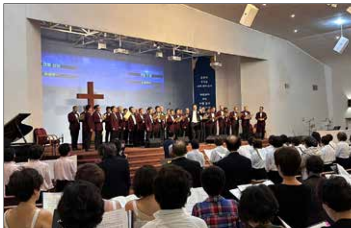
남가주장로협 주최 사랑의 찬양제에서 참가자들이 연합으로 찬양하고 있다