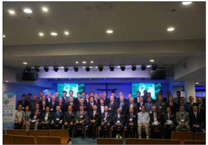
(사) 대한민국 국가조찬기도회 뉴욕지회 연례기도회를 마친 후 사진촬영 했다