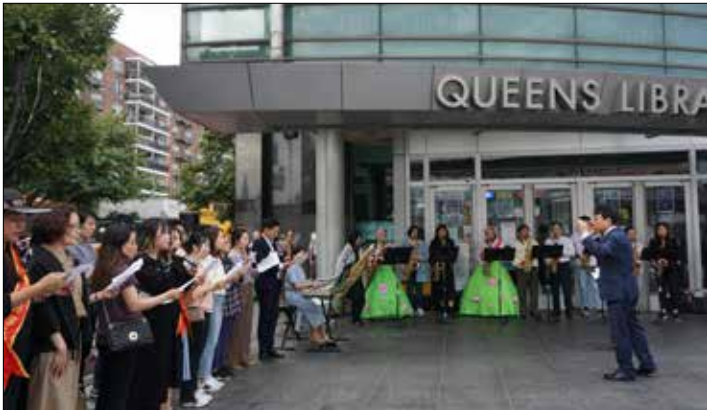
노방전도회에 참석한 모두가 연주와 찬양하고 있다