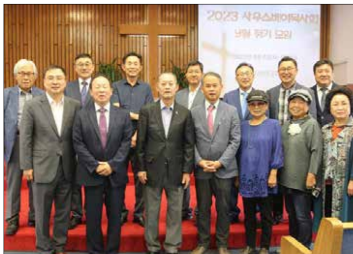
사우스베이한인목사회 9월 정기예배 참석자들이 기념촬영하고 있다