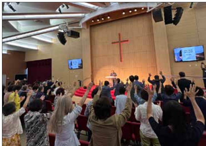
다민족연합기도대회 중보기도회에서 참석자들이 합심기도하고 있다

매가 맺혀야 하며 어디서든 영성의 향기가 전파 되어야 한다. 우리는 목자의 영성을 지닌 자로 목자의 영성을 강하고 아름답게 가꾸어 하나님이 기뻐하시는 종들이 되자"고 설교했다. 이날 백현 목사의 집례로 성찬예식이 있었으며 전태준 목사의 축도로 예배를 마쳤다. 이어 회원점명과 이대영노회장의 개회선언이 있던 후 각 부 보고와 안건 토의가 있었으며 금번 노회를 통해 이훈우 목사를 노회선교사로 파송하기로 결의했다. <이성자 기자>