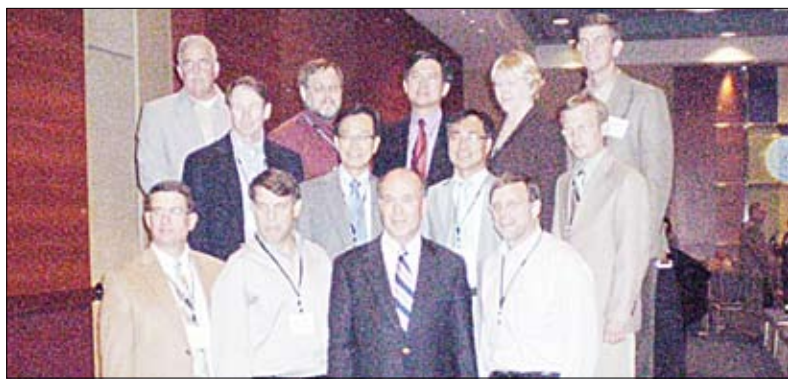
미네소타주 미니애폴리스에서 열린 ATS총회에서 미주장신, 미드웨스트, 그레이스 미션, 조지아크리스천대 등 4개 한인신학교의 준회원 승인후 관계자들이 사진을 찍고 있다