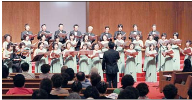
극동성가단의 제15회 정기연주회가 한길교회에서 열렸다

해 그 제한이 풀려졌다"고 말했다. 또 "7-12절에는 하늘에서 미가엘과 사탄의 전투가 벌어진다. 이는 하나님과 사탄의 전쟁인데 이 전쟁은 예수님의 승천으로 인해 일어나게 된다. 9절은 전쟁의 결과로 사탄이 하늘에서 쫓겨나는 것으로 끝나게 된다. 사탄이 쫓겨났다는 것은 사탄이 하늘에 있었다는 증거이며 예수님의 승천하기 전까지 사탄은 그곳에서 늘 하나님께 참소해왔다. 사탄은 예수님의 승천으로 인해 그곳에서 쫓겨나게 된다. 이는 십자가 사건의 결과"라며 "계시록은 1세기 성도들에게 신앙적 위기 속에서 황제숭배를 수용하지 않고 목숨을 잃을지라도 하나님을 믿는 믿음이 더 가치 있기에 그 믿음을 걸고 살아가게 하려 하는 것이다. 오늘날 우리에게도 외줄타기를 할 때가 있다. 매순간 몸부림치고 있지만 순간 정신을 놓을 때가 있다. 그리고 후회하고 안타까움을 느끼고 아픔을 가지곤 한다. 계시록은 승리의 확신을 주고 위로를 준다. 이 위로를 받고 격려와 도전받는 소망을 가지고 살기 바란다"고 당부했다. (박준호 기자)