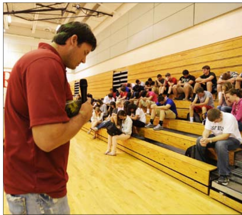
교내 기도운동이 학교폭력 예방책으로 부상하고 있다

1960년대 이전에 미국은 보수적인 "WASP"(White Anglo-Saxon Presbyterians)의 성경중심 사상이 미국을 이끌어 오늘의 번영을 초래했으며 오직 성경이 생활의 유일한 법칙으로 나라의 경사가 있을 때나 위급할 때 사람들은 교회에 모여서