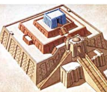
지구라트 아브라함이 살았던 우르 지역에서 발견된 지구라트 모형: 바벨탑이 이런 모습이었을까?

들은 다른 가족들이 알아들을 수 없는 자기 고유의 언어를 가지고 세상으로 흩어졌다. 이 사건이 있는 지 얼마 되지 않아 바벨론 문명(BC 2234), 이집트 문명(2188), 그리스 문명(2089), 그리고 호주나미주 문명 등 바벨(현재의 중동)에서 가까운 곳일수록 더 일찍 문명이 발생했다. 이것들은 바벨탑 사건으로 흩어진 사람들이 남긴 역사적인 증거들이었다.