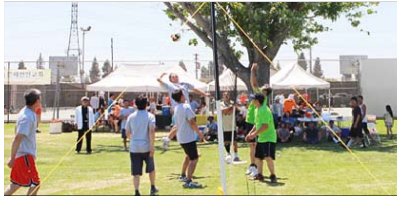
제32회 OC기독교전도회연합회 주관 교회연합 체육대회가 벨리크리스천 스쿨에서 열렸다. 사진은 은혜한인교회와 베델한인교회의 배구경기 모습

제32회 OC기독교전도회연합회(회장 손찬우 집사)가 주관한 교회연합 체육대회가 23일 벨리크리스천 스쿨에서 성황리에 열려 서문교회가 영예의 종합우승을 차지했으며 은혜한인교회가 준우승, 그리고 남가주사랑의교회가 3위를 차지했다. OC기독교교회협의회(회장 엄영민 목사)와 OC한인목사회(회장 신종은 목사)가 공동주최한 가운데 열린 이번 체육대회는 청년부 배구 종목은 2007-2010년 연속 4회 우승을 기록한 OC한미교회가, 장년부에서는 서문장로교회 우승을 차지했으며 축구종목은 작년에 이어 갓스