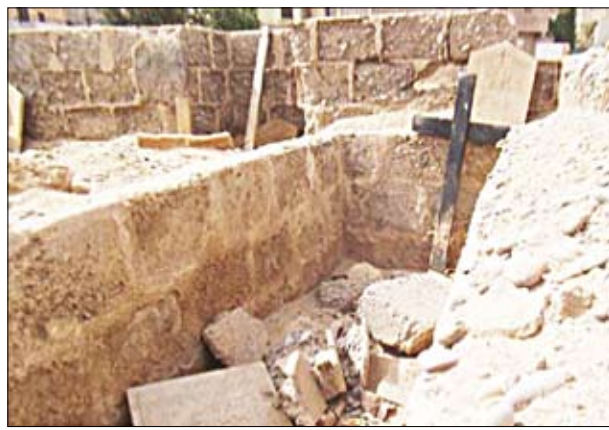
파키스탄에서 훼손당한 교인들 공동묘지

지난 18일 영국 BBC와 미국 CNN은 이슬람 과격 세력들이 나이지리아에서 또 기독교회를 공격 17명이 죽고 수십 명이 부상당했다고 짧게 보도했다. 물론 일본 방송도 보도하고 아사히신문도 기독교 신자들이 당한 것으로만 보도했다. 그런데 사우디에서 발행되는 Arab News 뉴스는 이슬람 원리주의 집단인 보코하람 그룹이 교회를 공격, 신도들이 죽자 기독교인들을 보복을 단행, 버스에 탄 무슬림들을 무차별 살해해 길거리에 많은 무슬림들이 밧고고 있다고 보도해 기독교인들이 무차별하게 보복했다는 것을 강조했다. 한국의 일부 언론도 아랍뉴스처럼 많은 무슬림들도 죽었다고 보도했다. 그런데 21일 아침 프놈펜 포스트지는 이 충돌이 확대돼 보코하람 테러리스트들이 군인과 경찰 공무원까지 무차별 살해하는 일이 벌어져 이 충돌로 많은 수가 죽었다고 보도한다. 나이지리아 남부는 기독교인들과 토속 신앙을 믿는 사람들이 다수이고 북쪽은 무슬림이 다수이다. 그래서 항상 기독교와 무슬림의 충돌이 심각하다. 그러나 다른 아시아 나라에서는 기독교 신자들이 보복할 만한 힘이 전혀 없어 당하고만 있다. 지난주 파키스탄에서도 교회가 공격을 당했다. 그러나