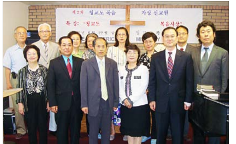
청교도 세미나를 마치고 참석자들이 기념촬영 했다.