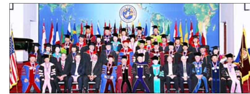
미드웨스트대학교 학위수여식을 마치고 교수 졸업생 등이 기념촬영 했다.