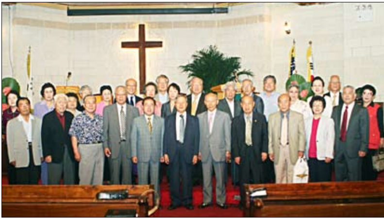
뉴욕원로목사회 6월 월례예배를 마치고 참석자들이 기념촬영 했다.

뉴욕초대교회(담임 김승희 목사)가 도미니카와 아이티 선교활동 지원을 위해 7월 2일(월) 정오에 골프대회(준비위원장 박종규 장로)를 개최한다. 동 교회는 7월 23일부터 8월 2일까지 도미니카와 아이티에 단기선교팀 30명을 파송한다. ▲문의: (917)923-9660